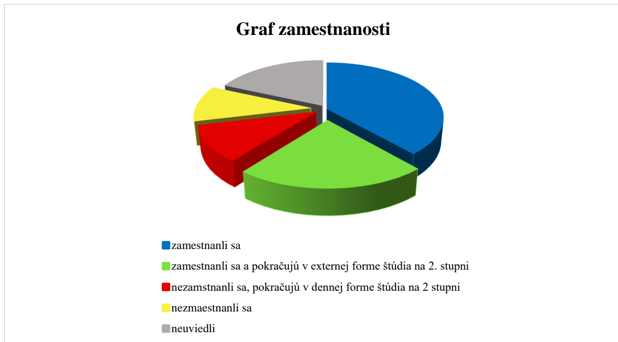
Graf č.2 Zamestnanosť v súlade s vyštudovaným programom v študijnom odbore bezpečnostné vedy